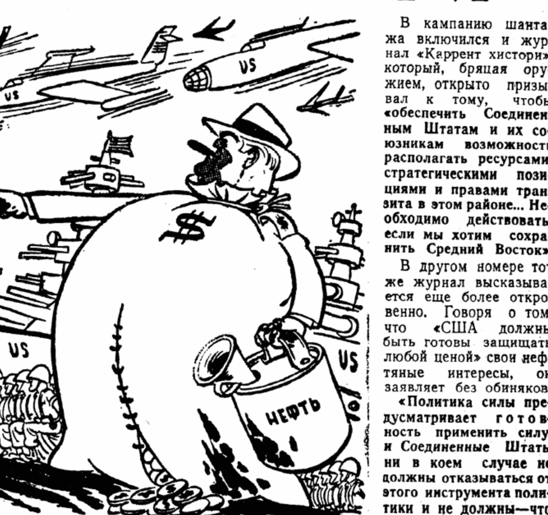
Главномандующий американской оккупационной армией в Ливане... Рис. Н. ЛИСОГОРСКОГО

Вот что ринулись защищать вооруженные орудия современных колониализаторов! Борзя нефтяных монополий потерять свои миллиардные прибыли, получаемые в результате грабежа народов арабских стран,