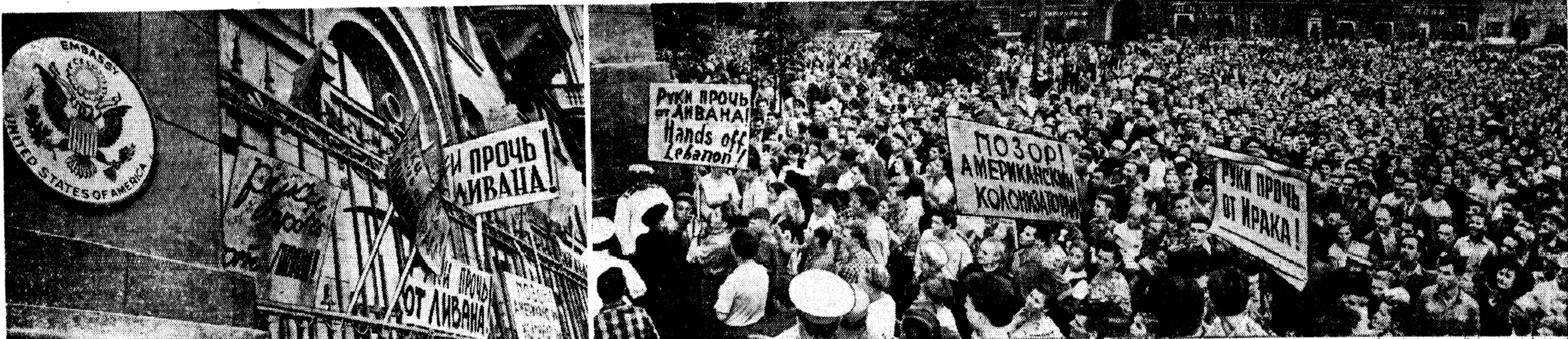
Тысячи москвичей собираются у здания посольства Соединенных Штатов Америки, чтобы выразить свое возмущение наглыми действиями США в Ливане. Лозунги, прикрепленные демонстрантами к фасаду здания посольства, требуют прекращения американской агрессии на Ближнем и Среднем Востоке.