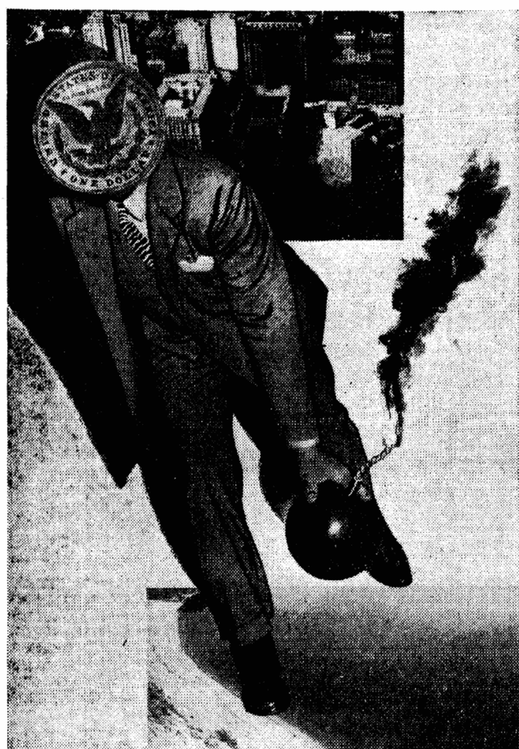
Фотомонтаж А. ЖИТОМИРСКОГО